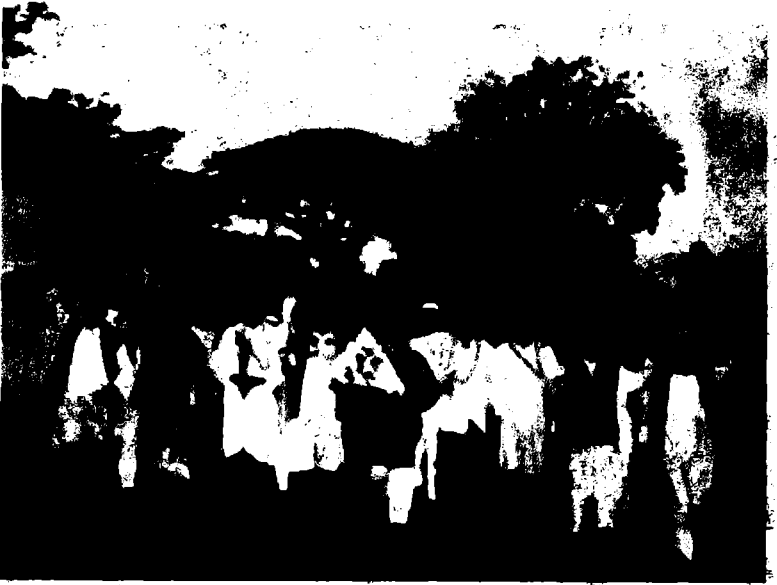
১৯৯৮ সালে বি-বাড়িয়া কারাগার থেকে মুক্তি লাভের পরবর্তী মিছিল