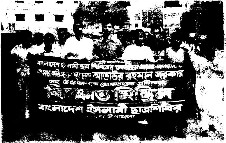
২০১০ সালে লেখককে গ্রেফতারের পর তার মুক্তির দাবীতে কসবা উপজেলায় বিক্ষোভ মিছিল